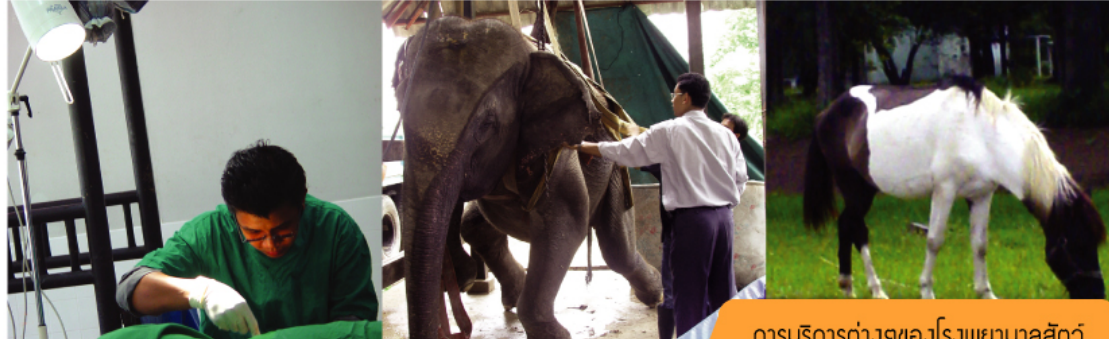
การบริการต่างๆของโรงพยาบาลสัตว์